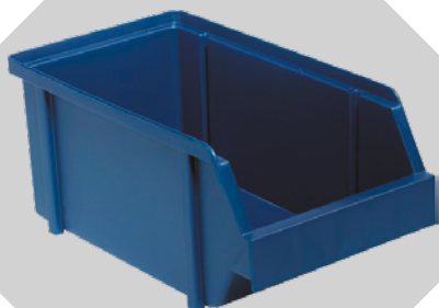
BAC BIN 4