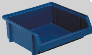
BAC BIN 2