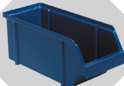
BAC BIN 5