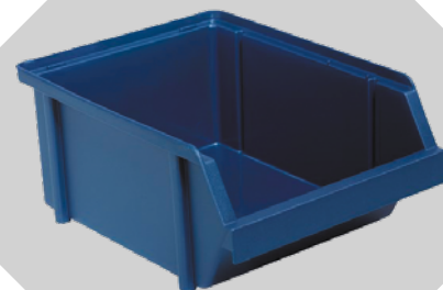
BAC BIN 3